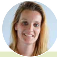
Alèt Benjamins Groepsleerkracht